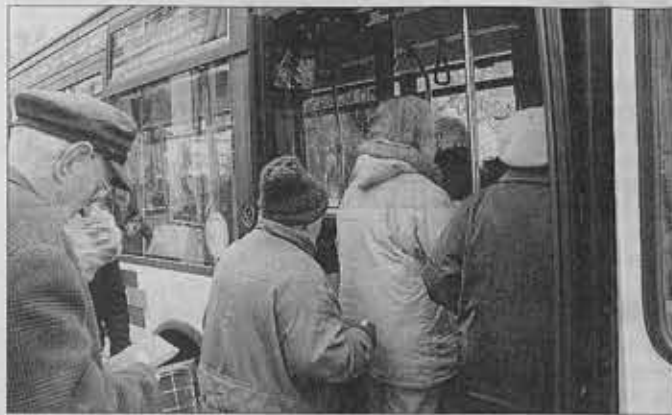
BUS. Pendant deux mois, les horaires habituels sont à remiser aux placards.

Le service été de la Stabus sera mis en application du lundi 2 juillet au samedi 1 er septembre pour le réseau urbain et du lundi 2 juillet au lundi 3 septembre inclus pour le réseau périurbain.