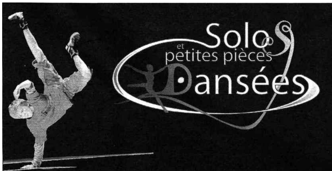
Les Solos et Petites pièces sont interprétés par des élèves en formation qualifiante et servent à leur évaluation