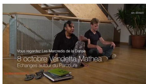
Replay du rendez-vous du mercredi 8 octobre

-Auditions en public : évaluation des étudiants en danse en public (Solos et Petites Pièces dansées, ...)