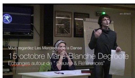
Replay du rendez-vous du mercredi 15 octobre