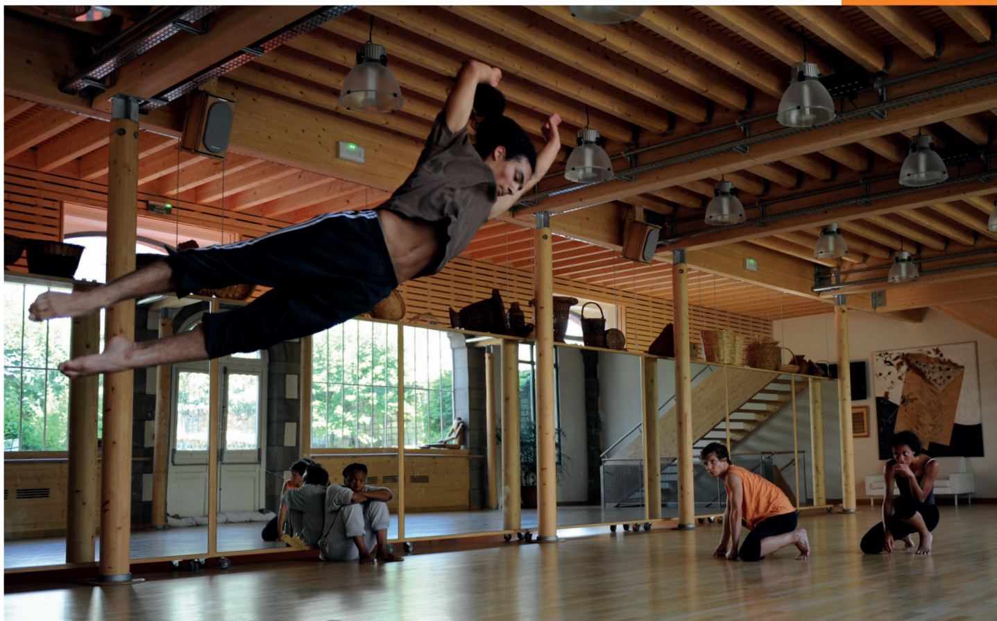
La Manufacture Vendetta Mathea Formation & Métier de la Danse Aurillac France